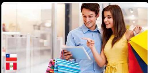
Zona Turística y Comercial