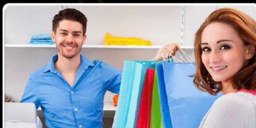
Dueño de tu local propio