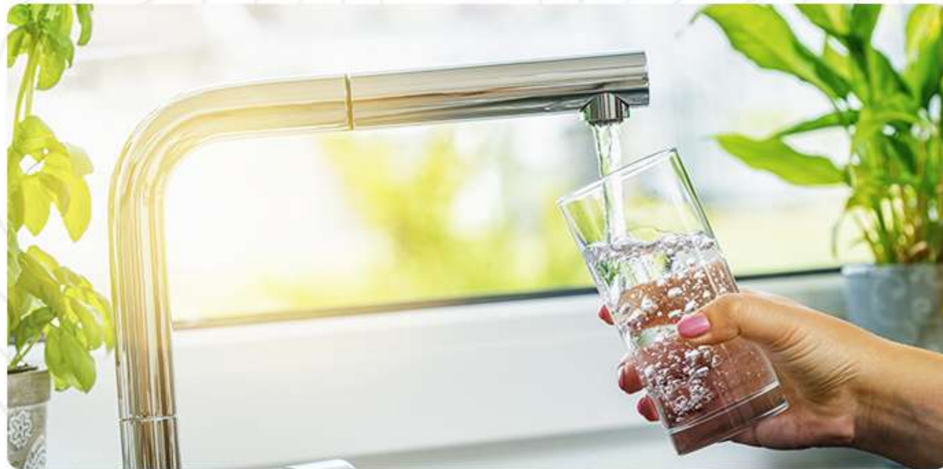
Servicio de Agua Potable

Nos complace anunciar una emocionante mejora: ¡la introducción de conexiones individuales para los tres servicios básicos esenciales!