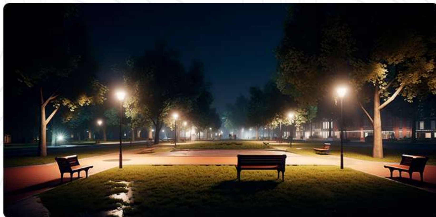
Servicio de Luz Eléctrica Independiente

Agua, Luz y Desagüe con Conexión Individual